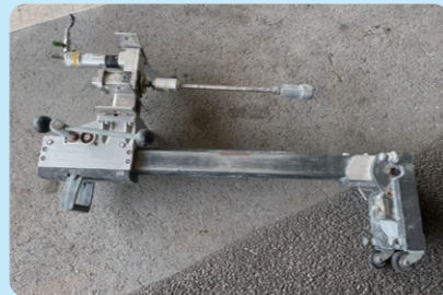
コンクリート削孔