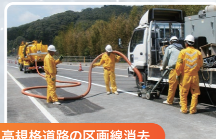
高規格道路の区画線消去