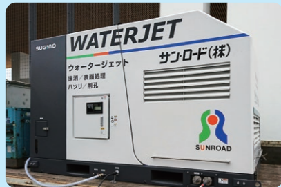
HI-JET 3000ST(2台) (最高圧力 245MPa・最大吐出流量 22L/min)