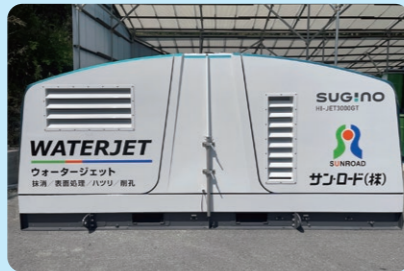
HI-JET 3000GT(2台) (最高圧力 280MPa・最大吐出流量 40L/min)