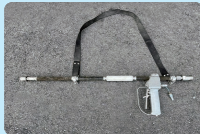
表面処理・塗膜除去処理・ハツリ