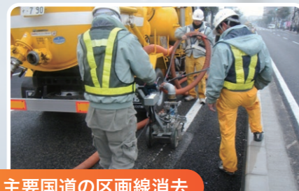
主要国道の区画線消去