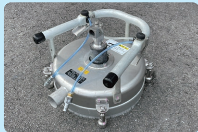
表面処理・塗膜除去処理・洗浄処理