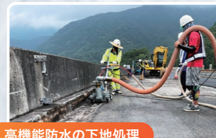
高機能防水の下地処理